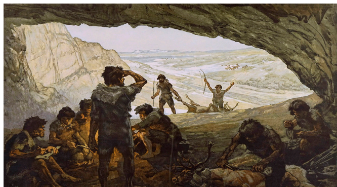
Tableau mural suisse des éditions Ingold - «Les hommes des cavernes» n°30

Tableaux muraux éditions Ingold : Un nouveau projet verra le jour en 2023, il sera supervisé par la collaboratrice scientifique de la FVPS : il s'agira de donner un prolongement à un mémoire professionnel de recherche « Tableaux scolaires suisses, Sonderfall et défense spirituelle : la Collection suisse de tableaux muraux Ingold entre 1936 et 1995 » rédigé par un étudiant de la HEP Vaud. Ce travail s'appuiera sur les travaux de numérisation effectués de septembre 2016 à mars 2017 en collaboration avec le Schulmuseum de Berne qui a mis, à la disposition de la FVPS, les 252 tableaux.