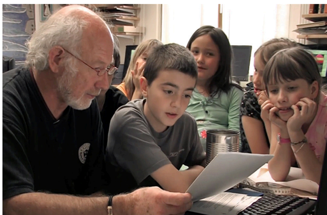
Image tirée du documentaire de la visite virtuelle, «L'école au cœur de la vie sociale»